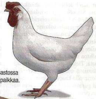
Yhdessä osastossa on 48 kanaapaikkaa.