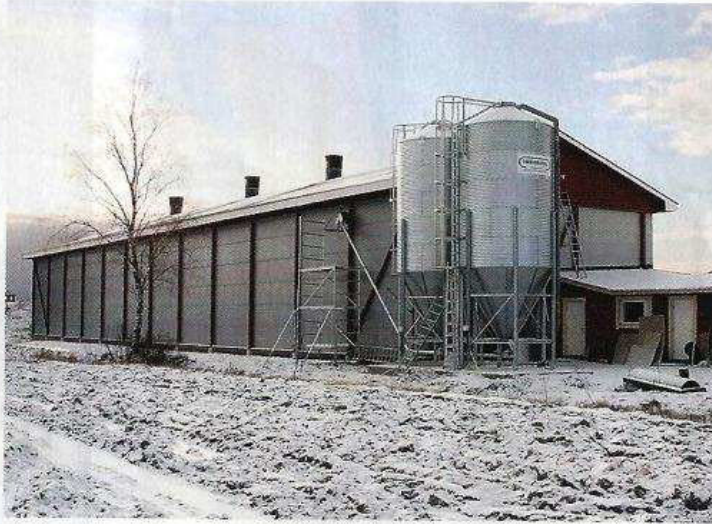
↑ Kajanderin kanalarakennus on komea näky. Modernin oloinen rakennus sulautuu mukavasti maalaismaisemaan.

Pienryhmäosastoja on hallin pituudella neljässä eri rivissä kuusi kerrosta päällekkäin. Hoitotasoja on kaikkiaan viisi – kaksi hallin ulkoseinillä ja kolme osastojen keskellä. Yksittäinen pienryhmäosasto on 4,82 metriä pitkä ja 1,83 metriä leveä. Yhdessä pienryhmäosastossa on 48 kanaa – tästä tu-